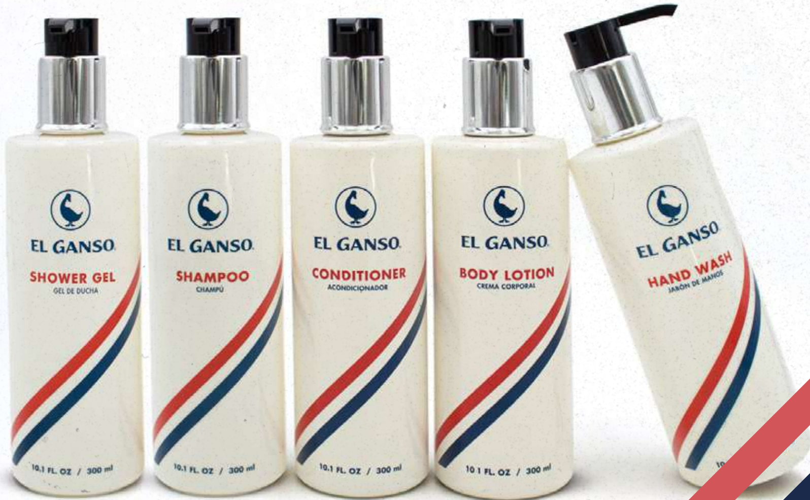
Colección de dispensadores 300ml